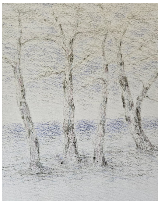
Dessin de Anne Seval

« Si nous n’avons plus que peu de temps, si le monde autour de nous vacille et que la mort, sous toutes ses formes, avance, il ne nous reste qu’à faire d’un coin de terre, peu importe lequel, un endroit accueillant, un lieu pour plus de vie. »